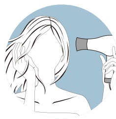
スチームドライヤー