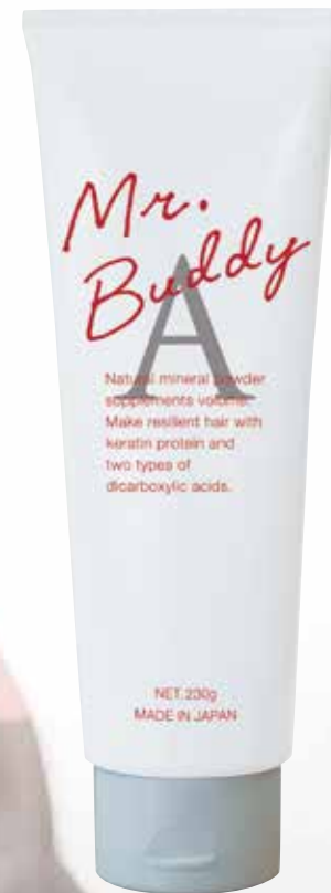
ミスターバディ ジェルA

“超ハードで速乾”がコンセプト。忙しい20～30代向けに、乾きの速さとカリッカリなセット力が特徴のスーパーハードジェルです。柑橘系の爽やかな香りです。