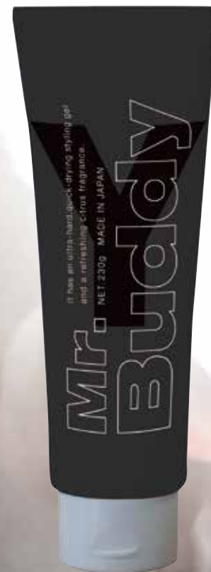
ミスターバディ ジェルY