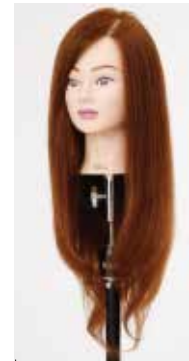
NB-WU2 N.B.A.A. UP WIG II BROWN アップウィッグ II ブラウン