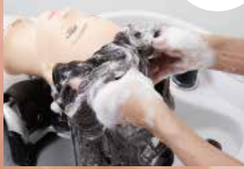
NB-WU2R N.B.A.A. UP WIG II PREMIUM REMY エヌ・ビー・エー・エー・アップウィッグ II プレミアムレミー [カラーレベル 5トーン以下]