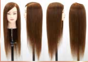
NB-WA N.B.A.A. ARRANGE WIG エヌ・ビー・エー・エー・アレンジウィッグ [カラーレベル 10トーン]