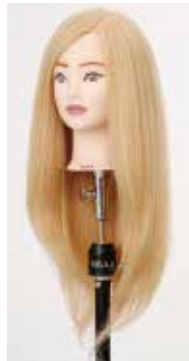
NB-WU2PB N.B.A.A. UP WIG II PLATINUM BLONDE アップウィッグ II プラチナブロード