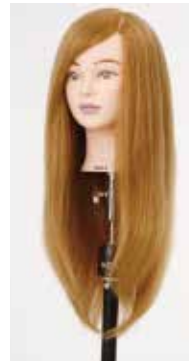
NB-WU2B N.B.A.A. UP WIG II BLONDE アップウィッグ II ブロード