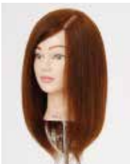
NB-WC2 N.B.A.A. CUT WIG II BROWN カットウィッグ II ブラウン