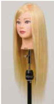
NB-WU2S N.B.A.A. UP WIG II SHINY アップウィッグ II シャイニー