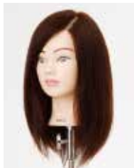
NB-WC2D N.B.A.A. CUT WIG II DARK BROWN カットウィッグ II ダークブラウン