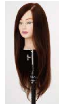
NB-WU2D N.B.A.A. UP WIG II DARK BROWN アップウィッグ II ダークブラウン